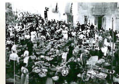
Mercat de Benissanet al 1950