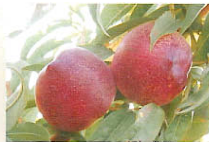
Nectarines, varietat de l'auberge