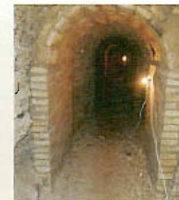
refugi Guerra Civil