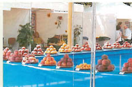
Mostra de l'auberge